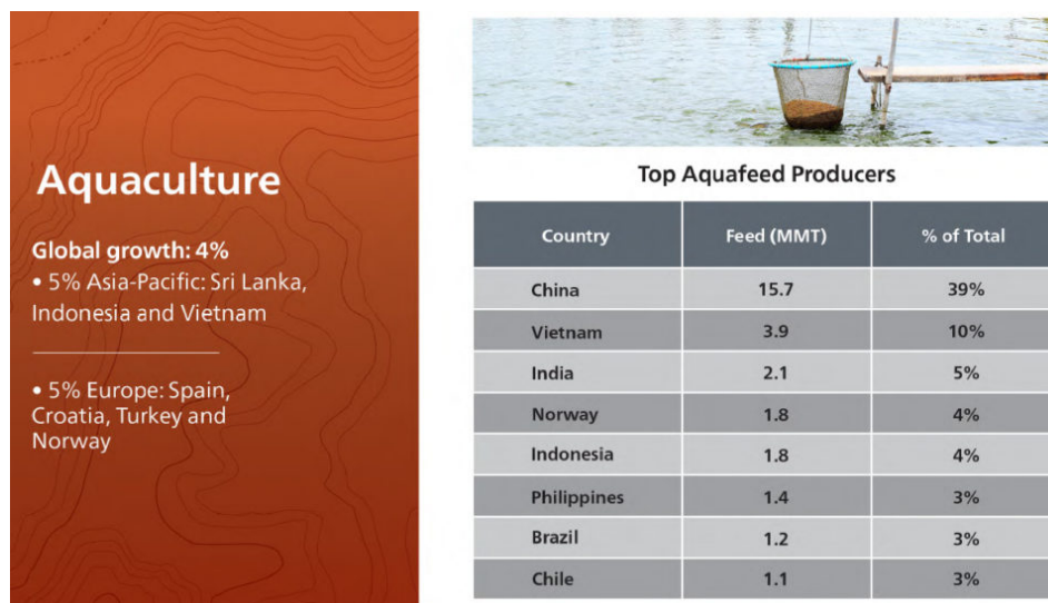
Fig. 2: Principales países productores de alimentos acuícolas.

Si bien la industria en su conjunto está creciendo, ciertos desafíos dentro de la región de América Latina están causando conflictos internos y estos problemas económicos se multiplican en múltiples industrias. La pequeña disminución con respecto al año pasado se debe en gran parte a Venezuela, Colombia y Nicaragua, ya que todas muestran disminuciones bastante significativas en la producción de alimentos acuícolas, muy probablemente debido a sus economías volátiles en la actualidad. El mayor productor de la región, Brasil, registró un crecimiento del 4 por ciento en la producción de alimentos y el segundo más alto, Chile, se mantuvo estable.