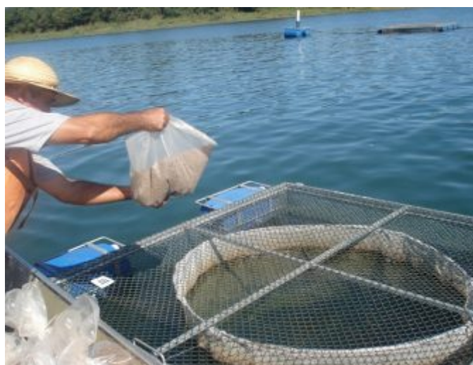
Alimentando a las tilapias durante el ensayo.

En la cosecha, el grupo alimentado con la dieta suplementada con el modulador de intestino mostró parámetros de producción significativamente mejorados en comparación con el control, incluyendo un aumento del 4,7 por ciento en la supervivencia, un 2,8 por ciento mayor peso final promedio, 6,7 por ciento mejor FCR, y consumo de alimento 6,7 por ciento menor. En general, la biomasa cosechada fue 7,7 por ciento más alta para el grupo de tratamiento con respecto al de control (Tabla 1; Fig. 2).