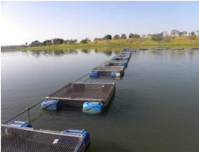
Vista de las jaulas de tilapia usadas en el estudio.

general de los peces, lo que lleva a una mayor resistencia a las enfermedades. Resultados en peces marinos y camarones demostraron los efectos positivos de los promotores de la salud del intestino en el rendimiento y la rentabilidad en condiciones de campo (Chamorro et al. 2011; Tzouramanis et al. 2012; Valle et al. 2015). En este estudio, evaluamos el efecto de un aditivo promotor de salud intestinal sobre los parámetros de producción de tilapias criadas en jaulas en Brasil.