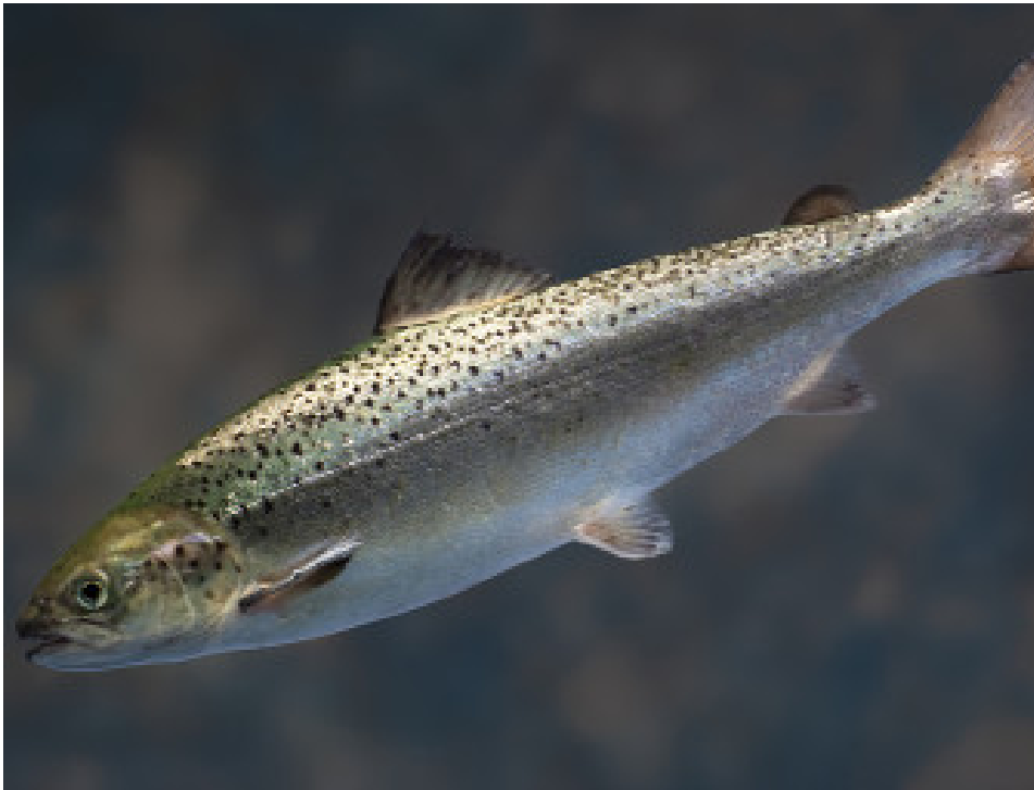
Salmón de AquaAdvantage.

Murkowski se comprometió a bloquear el procedimiento de confirmación del nominado para ser comisionado de la FDA, el Dr. Robert Califf, en el piso del Senado si la agencia no abordaba sus preocupaciones de larga duración para exigir que cualquier GM sea etiquetado como tal en los puntos de venta. El Senado confirmó a Califf como nuevo comisionado de la FDA en febrero; Murkowski había levantado su oposición.