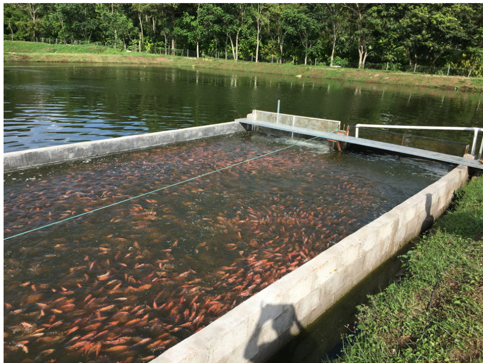
Vista del raceway en estanque de demostración y los peces.

Este artículo presenta los resultados de un proyecto piloto de sistema de raceway en estanque (IPRS) que cultiva tilapia roja en una granja comercial en Honduras. La adopción de esta tecnología ha sido respaldada por el Consejo de Exportación de Soya de los EE. UU. (USSEC) como una estrategia para aumentar la producción de peces, reducir el impacto ambiental al mejorar la gestión de los alimentos, y la gestión de la carga de desechos de la producción de alto nivel.