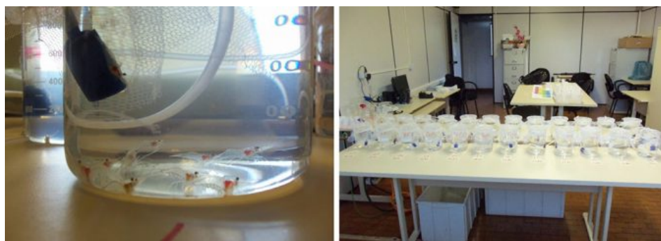
Vistas de las unidades experimentales utilizadas para la prueba de postlarvas de langostinos.

Nuestro trabajo de investigación se realizó en el Laboratorio de Cultivo de Langostinos, ubicado en la Universidad Federal de Paraná. Se utilizaron 240 langostinos de cada uno de los tres estadios de vida (postlarvas, juveniles y adultos) y para cada compuesto ensayado (amoníaco y nitrito), divididos al azar en 24 unidades experimentales. Las unidades consistieron en un vaso con un volumen de 1 litro para postlarvas y acuarios de vidrio con 10 litros de volumen de agua útil para juveniles y adultos. El diseño fue completamente al azar, con seis concentraciones diferentes de amoníaco total (0, 5, 10, 20, 40 y 80 \text{mg}\cdot\text{L}^{-1} de amoníaco) y seis concentraciones de nitrito (0, 1, 2, 4, 8 y 16 \text{mg}\cdot\text{L}^{-1} de nitrito), con cuatro réplicas.