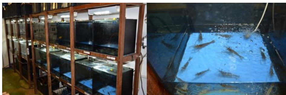
Vistas de las unidades experimentales utilizadas en el estudio para ensayos de langostinos juveniles y adultos.