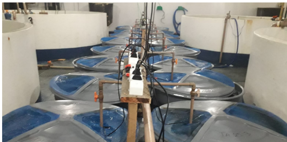
Sistema experimental compuesto por quince tanques aireados de 300 litros que utilizaron mangueras microperforadas y calentadores de

Se inoculó biofloc maduro de otro tanque en los tanques experimentales al comienzo del experimento al 10 por ciento del volumen total del tanque. La relación carbono: nitrógeno (C: N) utilizada para el mantenimiento del biofloc fue de 15: 1 y, cuando fue necesario, se aplicaron melaza (36 por ciento de C) y cal hidratada para mantener la alcalinidad en niveles adecuados.