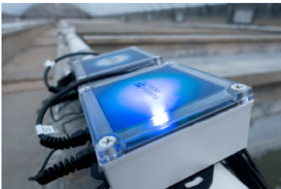
La iteración más nueva de Osmobot.

“Tener más información es simplemente mejor,” dijo Stein. “La acuicultura en general está detrás del resto de la cría de animales en términos de uso de datos y su comprensión sobre cómo usarla para mejorar los métodos de cultivo. Dados los bajos precios actuales, los productores están viendo cómo se ajustan sus márgenes, por lo que están buscando soluciones para optimizar y proteger esos márgenes. Los datos pueden ayudar a mostrarles el camino.”