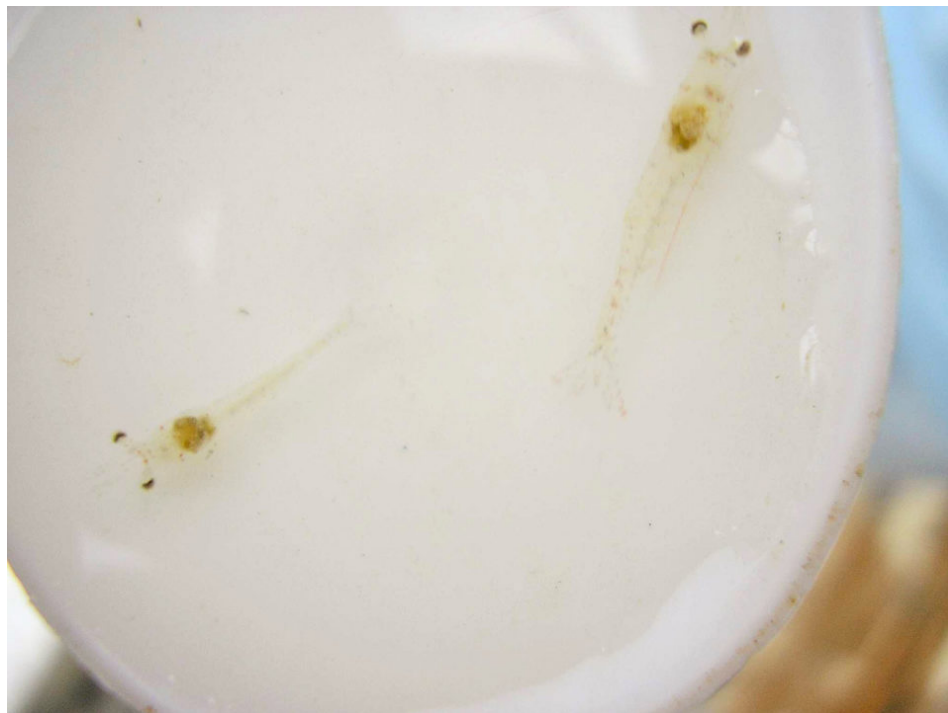
Camarón afectado PL con tripas vacías y HP pálidos.

Aproximadamente a las 7 a.m., los técnicos de pre-cría informaron a la gerencia que se observaron PL enfermas y moribundas en el tanque 6. Después de la consulta y discusión entre el personal y los gerentes a las 10 a.m., se iniciaron los pasos de intervención abajo: