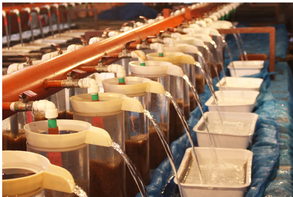
Sistema de incubación de huevos de tilapia en un criadero comercial de tilapia en Bangladesh.

Sin embargo, en los criaderos privados el uso repetido de la misma población de progenitores condujo a un mal manejo de los reproductores, y la no reposición con poblaciones nuevas resultó en la producción de semillas de calidad inferior y en la deriva genética en la población de criadero que inhibieron la producción sostenible de tilapia. Para mitigar esto, el BFRI llevó a cabo un proyecto de investigación de selección familiar bien diseñado entre 2005 y 2015 en el núcleo cerrado de reproducción de tilapia del BFRI, y de 2012 a 2016, WorldFish, Bangladesh y Asia Meridional se unió al esfuerzo para establecer y operar núcleos de cría al aire libre en criaderos de tilapia del sector privado en Bangladesh.