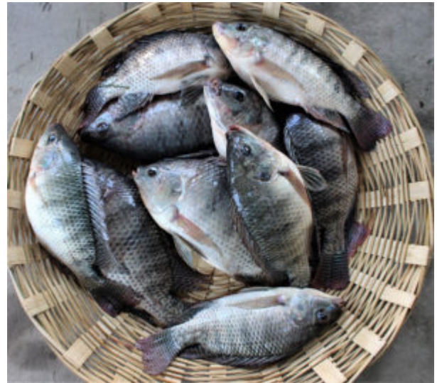
Cepa de GIFT mejorada de tilapia.

Esto fue seguido por la difusión de estas variedades mejoradas y la adopción de tecnologías de cría y acuicultura apropiadas y de bajo costo en un gran número de criaderos de tilapia y granjas en un lapso de 11 años (2005 a 2015), durante los cuales la producción de tilapia aumentó por un factor de más de 18 en Bangladesh (Fig. 1).