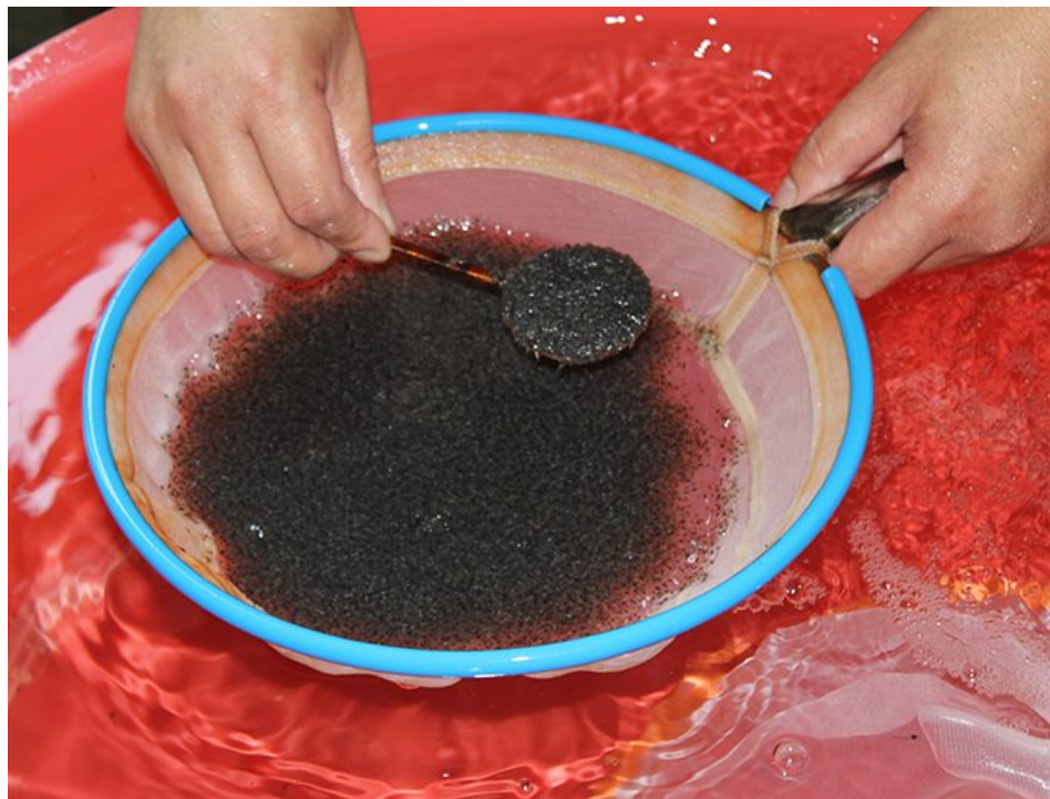
Postlarvas de L. vannamei siendo contadas.

La fase de criadero es un crítico y complejo primer paso en la producción comercial de camarón blanco del Pacífico, y se requiere atención constante para producir postlarvas de camarón de la mejor calidad posible.