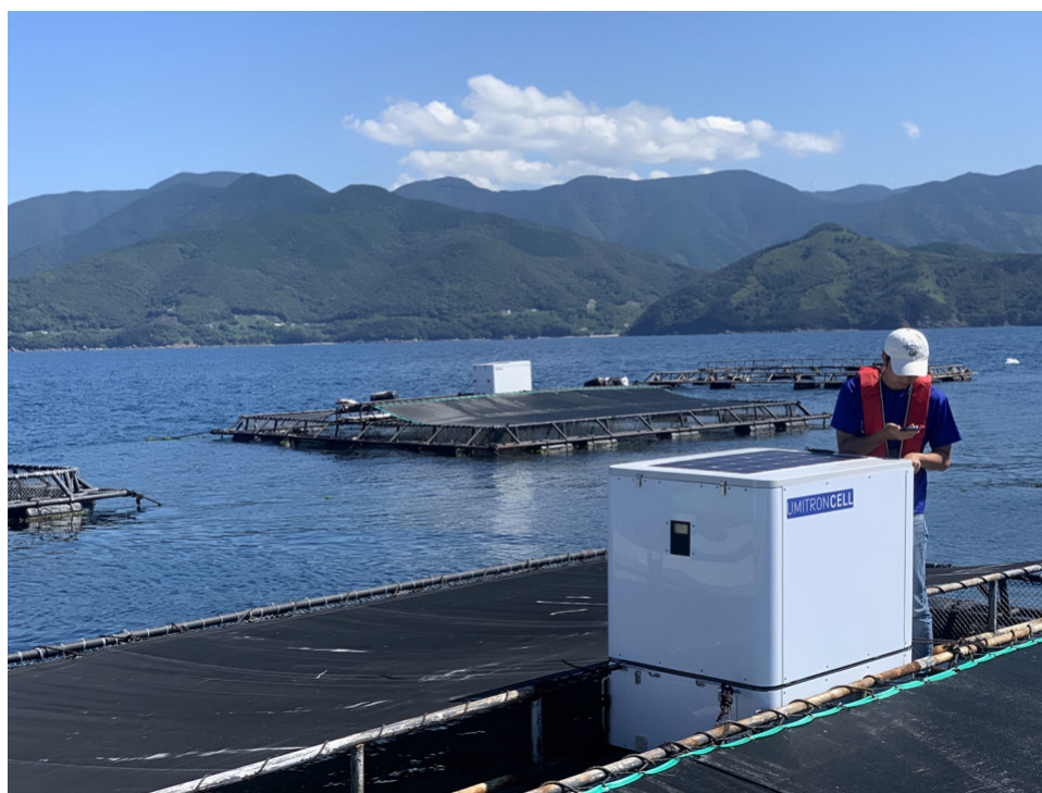
CELL en uso con los cultivadores de besugo rojo en Japón.

Las soluciones de alta tecnología como la inteligencia artificial están haciendo avances en la acuicultura. ¿Puede la IA impulsar un mayor crecimiento?