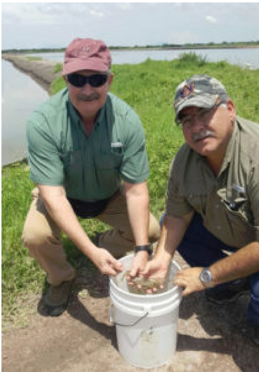
Autores durante una visita reciente a una granja de camarón en América Central.

problemas – mareas rojas, contaminación industrial, agrícola o urbana y otros – pueden ser eliminados en su mayoría.